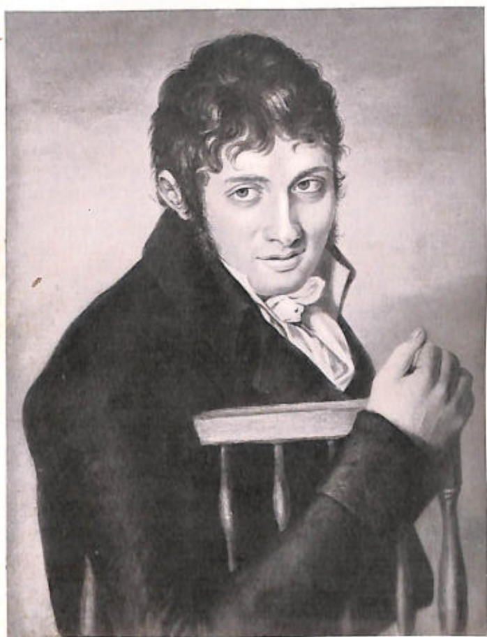
CLAUDE FAURIEL (1772-1844)

PEINTURE DE LA BIBLIOTHÈQUE DE L'INSTITUT DE FRANCE