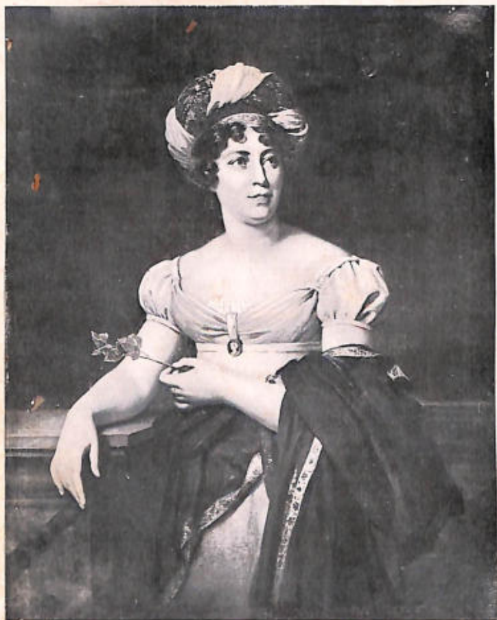
MADAME DE STAËL (1766-1817)