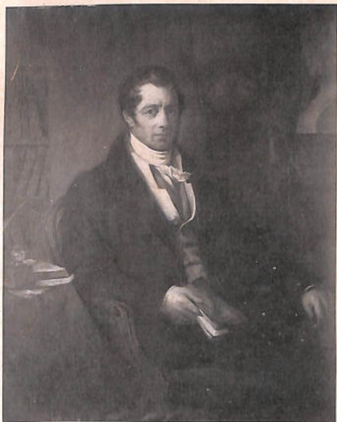
JEAN-BAPTISTE SAY (1767-1834)