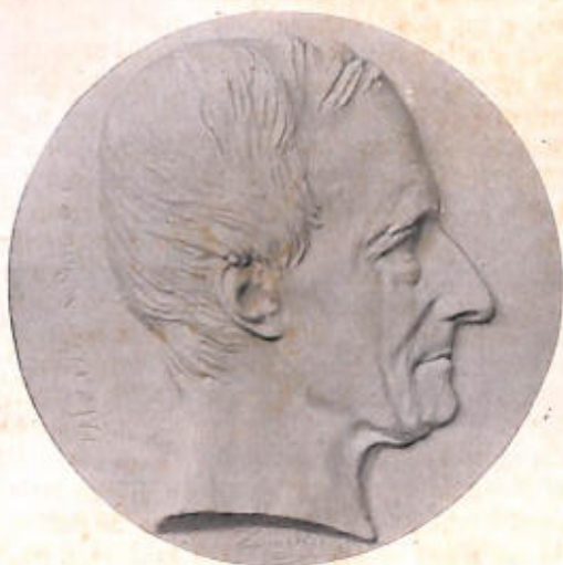
MERLIN de Douai (1754-1838)