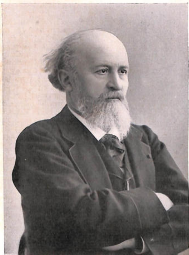
GASTON PARIS (1839-1903)