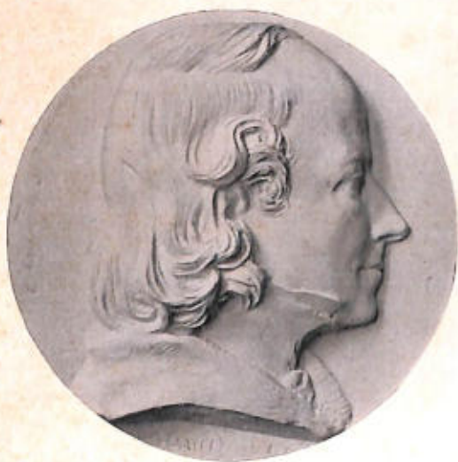
EUGÈNE BURNOUF (1801-1852)