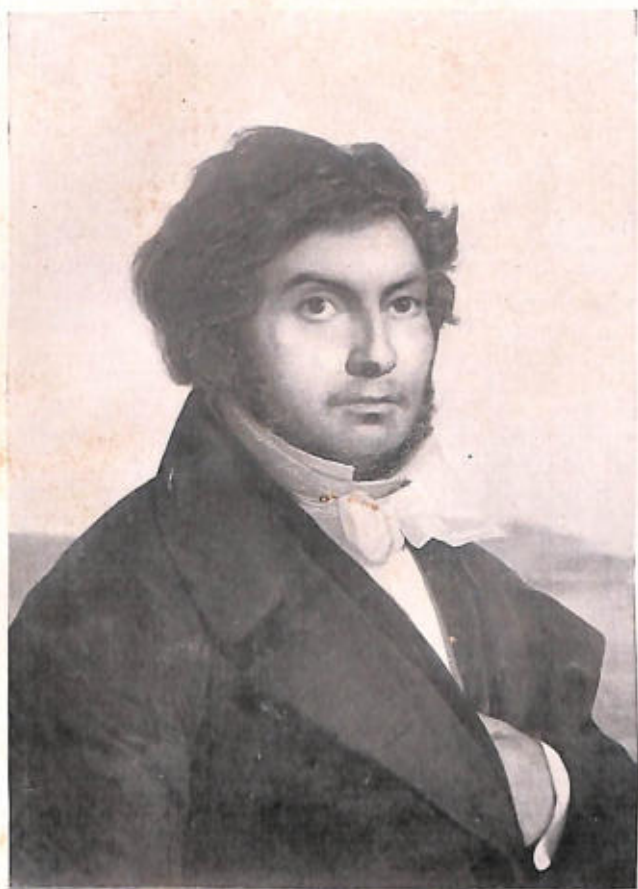
J.-F. CHAMPOLLION Le Jeune (1790-1832)