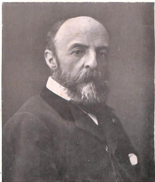
EUGÈNE FROMENTIN (1820-1876)