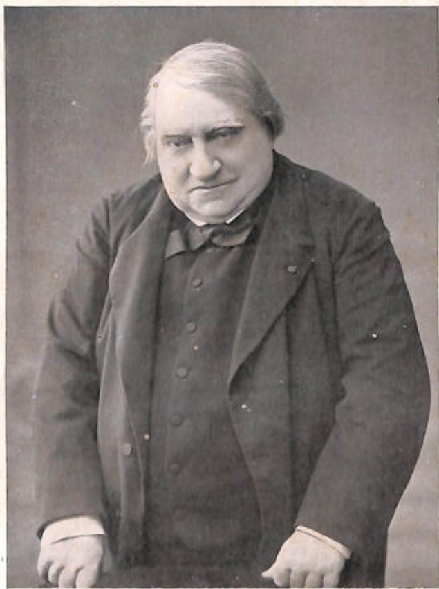
ERNEST RENAN (1823-1892)