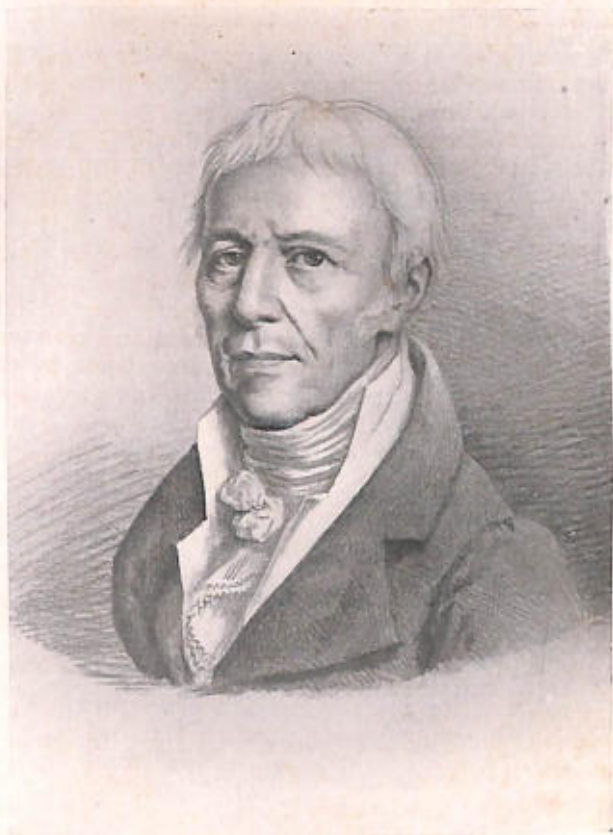
JEAN-BAPTISTE LAMARCK (1744-1829)