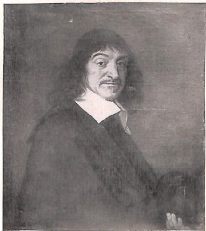
RENÉ DESCARTES (1596-1650)