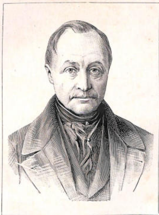
AUGUSTE COMTE (1798-1857)