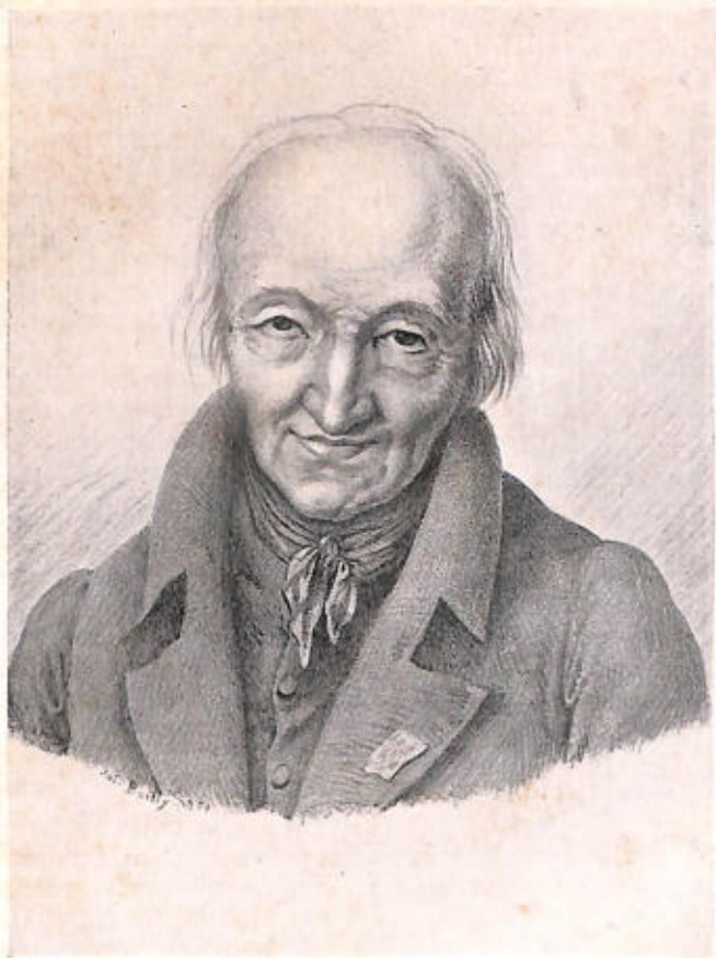
RENÉ-JUST HAÛY (1743-1822)