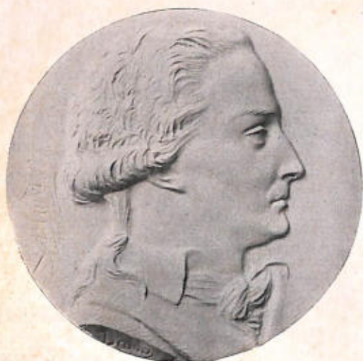
ANT.-L. LAVOISIER (1743-1794)