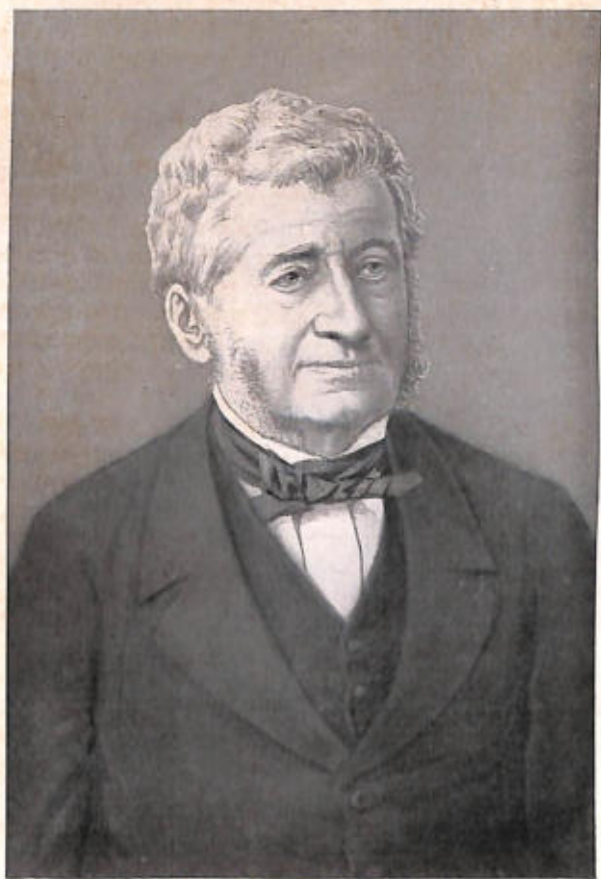
ADOLPHE BRONGNIART (1801-1876)