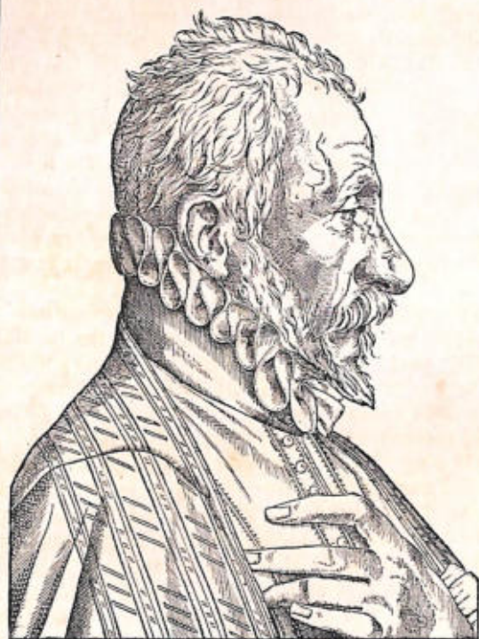
AMBROISE PARÉ (1517-1590)

FAC-SIMILÉ D'UN BOIS TIRÉ DES Œuvres d'A. Paré (1575)