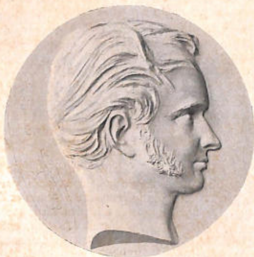
LOUIS ÉLIE DE BEAUMONT (1798-1874)