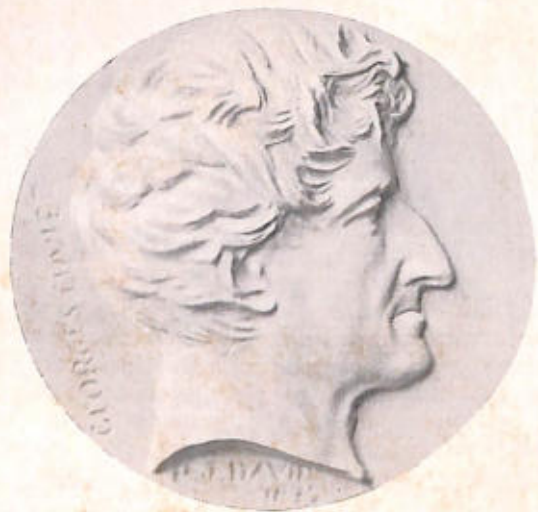
GEORGES CUVIER (1769-1832)