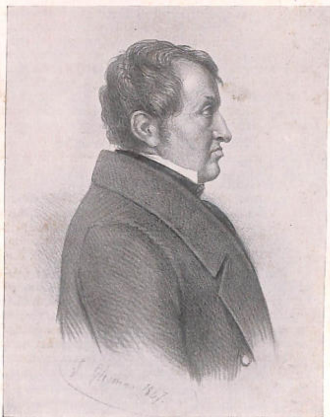
ANDRÉ-MARIE AMPÈRE (1775-1836)