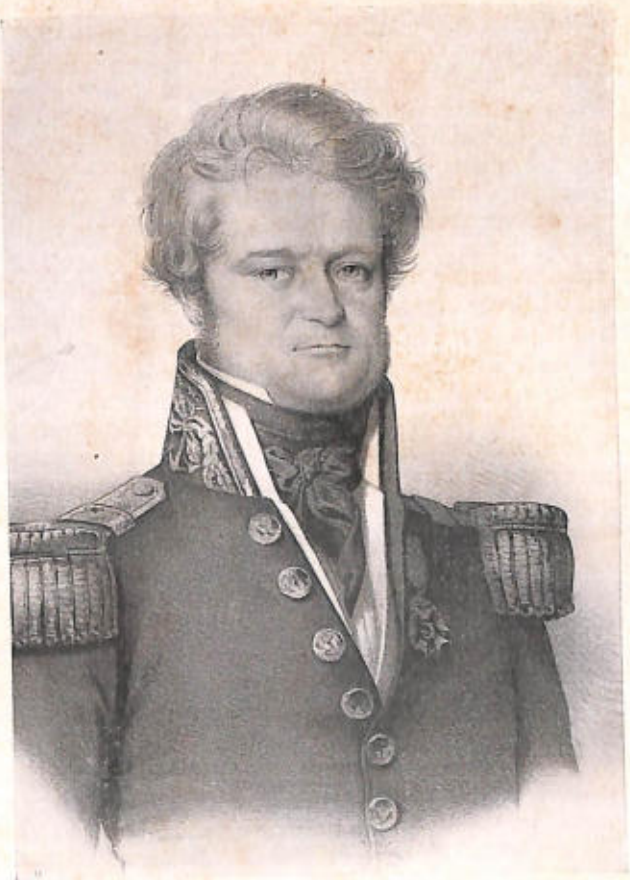
J.-S.-C. DUMONT D'URVILLE (1790-1842)